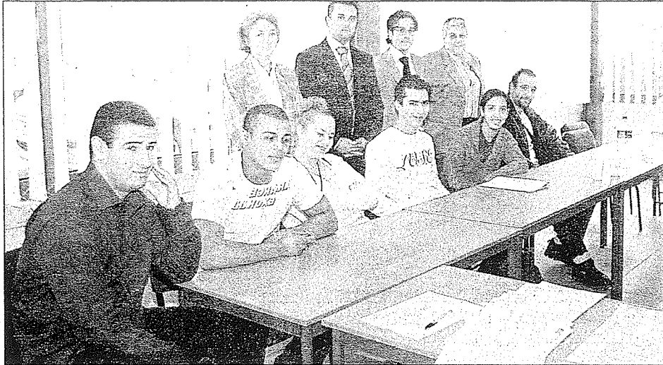
Vingt-quatre jeunes du bassin cannois se sont présentés, hier, à Mission Locale de La Bocca pour répondre aux 18 offres d'emploi de vendeur approvisionneur, proposées par la société Metro.

N EUFS postes à pourvoir à Nice et neuf dans le bassin cannois. Mission : vendeurs approvisionneurs . L'offre émane de la société Metro , centrale nationale d'achat et d'approvisionnement de grossistes. Avec une spécificité : ce recrutement s'adresse aux jeunes de moins de 26 ans, non diplômés. Il s'inscrit dans le cadre des conventions que l'État a signées avec les moyennes et grandes surfaces pour lutter contre le chômage du public jeune . La présélection a été confiée au pôle emploi de la mission locale de Cannes (1). C'est ensuite l'ESTC (école des sciences et techniques commerciales) de Marseille, partenaire du groupe Métro, qui sélectionne les candidats et assure leur forma-